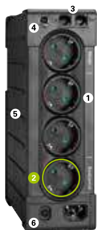
Eaton Ellipse PRO 650