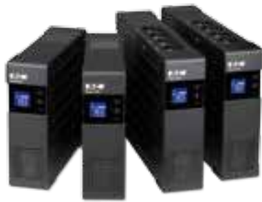
Ellipse PRO Baureihe