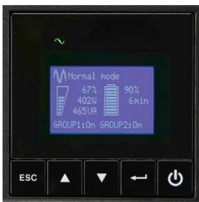
Grafisches LCD-Display der 9SX