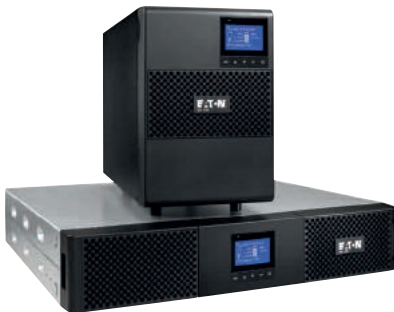
Rack- und Tower-Modell der 9SX