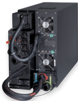
Eaton 9PX 11kVA mit Wartungsbypass

Die 9SX ist eine Energy Star® qualifizierte USV