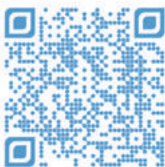
Video zur Eaton 9PX