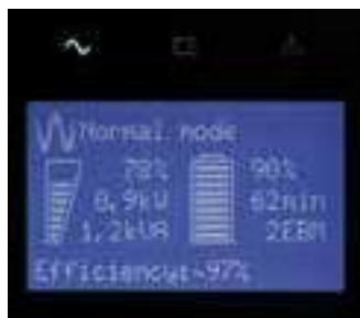
Intuitive LCD-Anzeige für einfache Konfiguration und Verwaltung