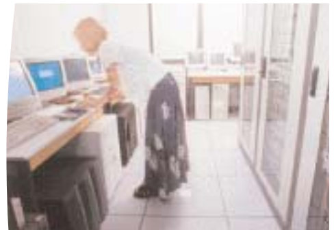
Doppelte Stromversorgung für Verbraucher mit einfacher Einspeisung