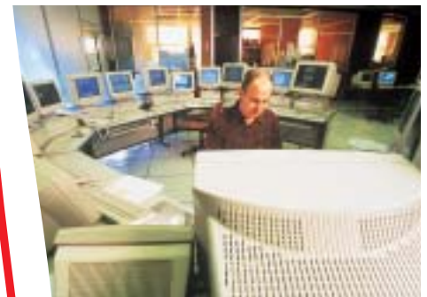
Kritische Anwendungen, die zwei unabhängige Stromquellen benötigen.