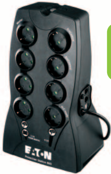
Eaton Protection Station 800